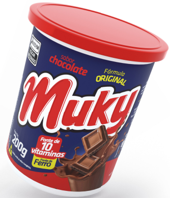
Muky Chocolate Pote 200g Cód. 44