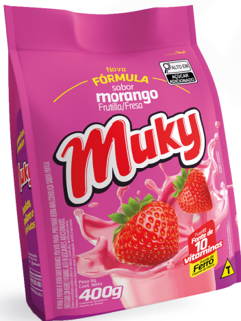
Muky Morango Pacote 400g Cód. 48