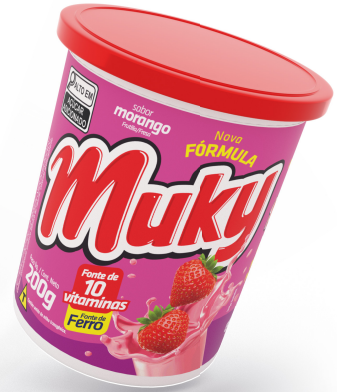
Muky Morango Pote 200g Cód. 43