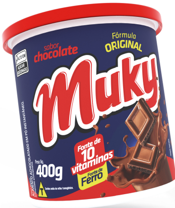
Muky Chocolate Pote 400g Cód. 30