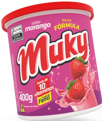
Muky Morango Pote 400g Cód. 31