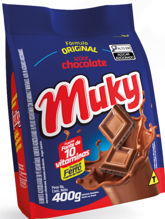
Muky Chocolate Pacote 400g Cód. 21